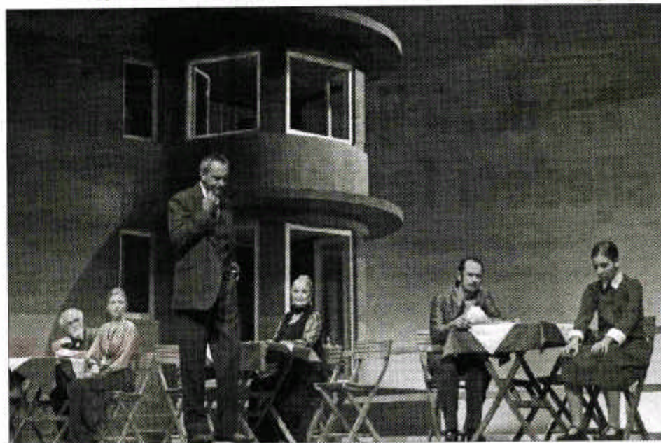
Cijela je drama sabljena u samo jednu noć

PREMIJERE UJAK VANJA U SPLITSKOM HNK, REŽIJA MATEJA KOLEŽNIK