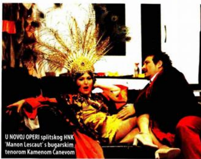
U NOVOJ OPERI splitskog HNK 'Manon Lescaut' s bugarskim tenorom Kamenom Čanevom