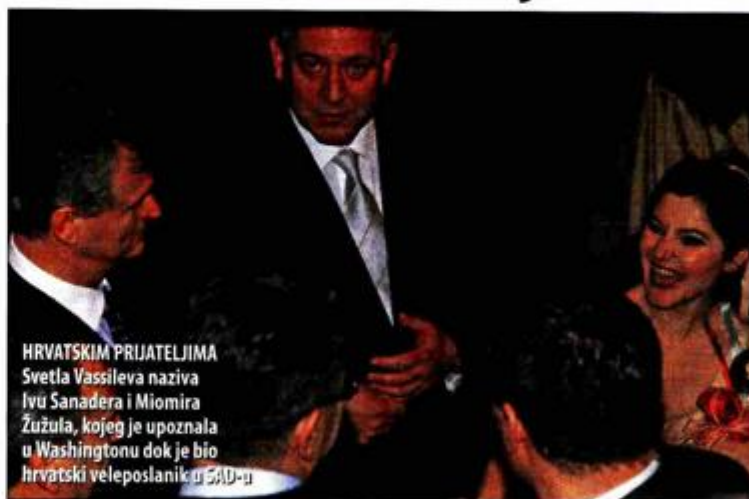
HRVATSKIM PRIJATELJIMA Svetla Vassileva naziva Ivu Sanadera i Miomira Žužula, kojeg je upoznala u Washingtonu dok je bio hrvatski veleposlanik u SAD-u

suradivala, ali njega rijetko vidam jer oboje mnogo putujemo.