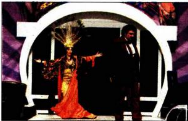
Maštovitu scenografiju napravio je Zlatko Kauzlaric Atac